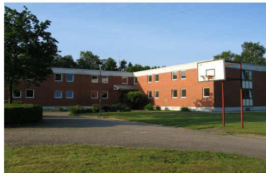
Frauenabteilung ab Okt. 2005

Der Bereich der Männerabteilung verfügt über eine Belegungsfähigkeit von ca. 195 Plätzen. Die Unterbringung erfolgt hauptsächlich in Saalgemeinschaften. Doppel- und Einzelbelegung ist im begrenzten Umfang möglich.